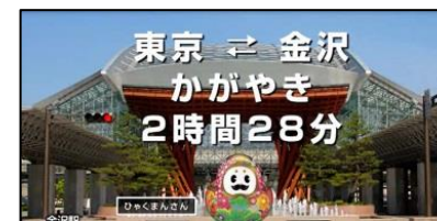
<メトロビジョンでのPR映像放映>