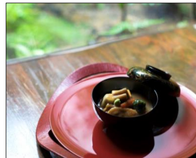
<百万石のたからもの>

<取り組み内容> ・ポスター・チラシの作成・配布、旅行会社パンフへの掲載、 ・HPの作成、大手飲食店情報検索サイトを活用した情報発信、 鮓の食事券販売