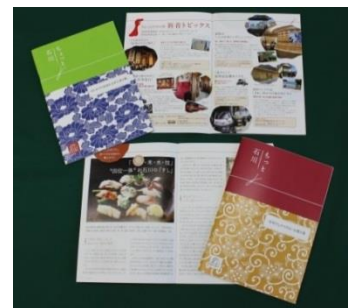
<石川県観光ガイドブック>