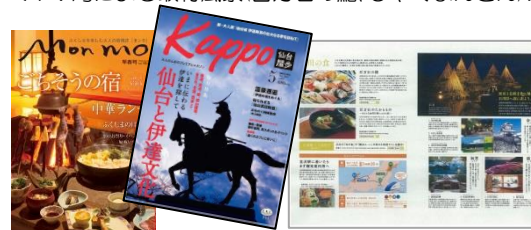
<タウン誌での石川県特集>