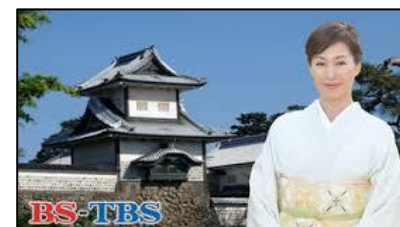
<高島礼子 日本の古都(2/10放送)>