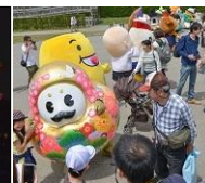
<ご当地キャラ大集合>