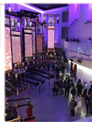
<輪島キリコ会館オープンフェア>