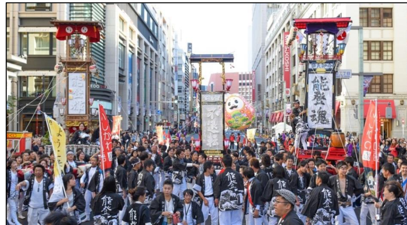
<能登キリコ祭りのパレード参加の様子>