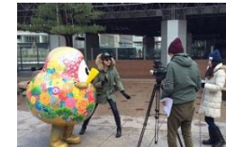
<TV局による取材風景(百万石の鮨、ひゃくまんさん)>