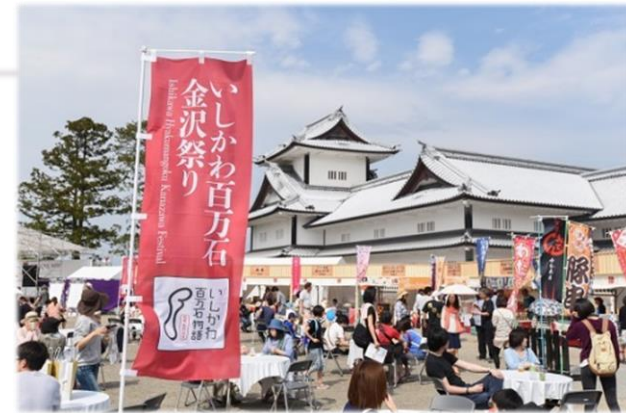
<イベント会場(金沢城公園二の丸広場)>