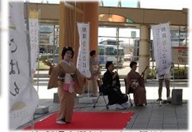
<加賀温泉郷おもてなし祭り>