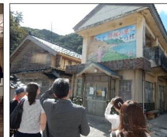
<いしかわ旅行商品プロモーション会議(H27.9)>