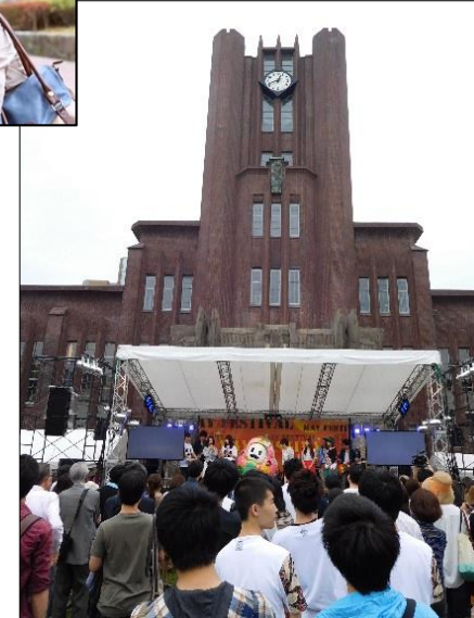
<東大五月祭での観光PRステージ>