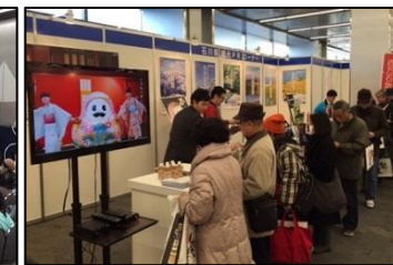
<いしかわ伝統工芸フェア>