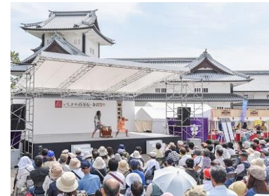
<ステージイベント(御陣乗太鼓)>