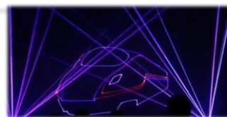
<のとレーザーショー(白虎山スポーツセンター)>