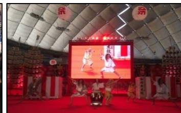
<ふるさと祭り東京>