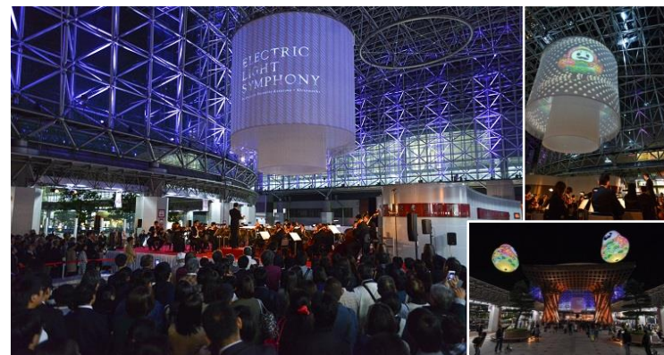
<ELECTRIC LIGHT SYMPHONY>