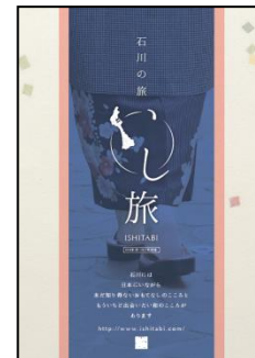
<「いし旅」パンフレット>