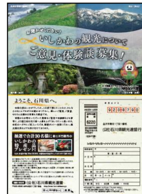
<アンケートはがき>