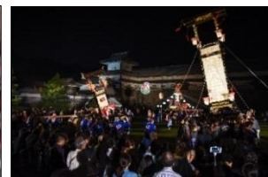
<北陸DCオープニングイベント(H27.10)>