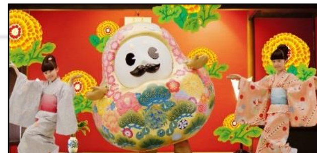
<観光誘客動画「いしかわ百万石物語～ひゃくまんさん小唄～」>

その他 県内の子ども達への普及のため、レッスン用映像と、モデル保育園で撮影した普及用映像を制作