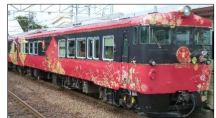
<七尾線観光列車「花嫁のれん」> 6