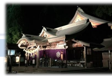
<うらら白山人春祭>