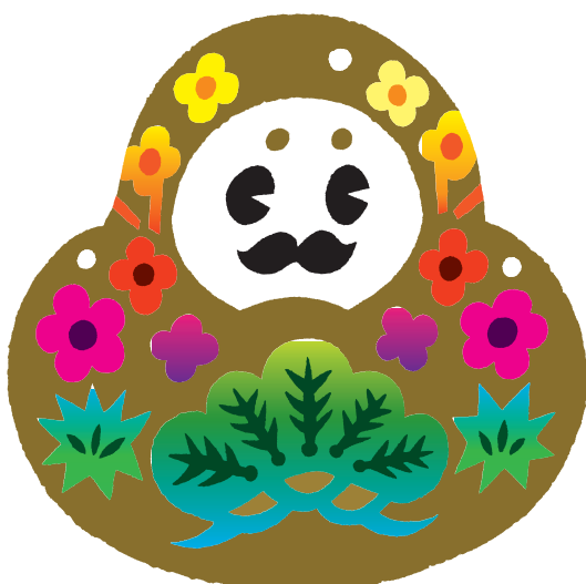
Type-1 (4C + GOLD + WHITE)