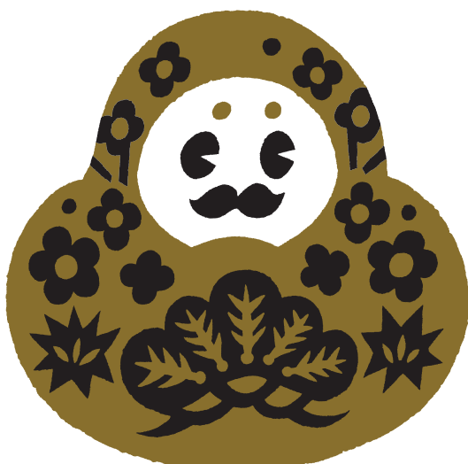
Type-3 (4C + WHITE)