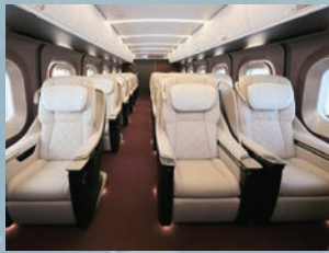
グランクラス客室

首都圏と北陸新幹線沿線をつ結び、日本の伝統文化と未来をつなぐという意味から、「和」の未来を新型車両のデザインコンセプトとしています。新型車両は12両編成で、プレミアムブランドである「グランクラス」を導入しました。大人の琴線に触れる「洗練さ」と、心と体の「ゆとり・開放感」で、新たな鉄道の旅を提供します。