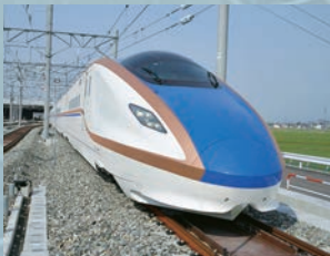
北陸新幹線新型車両W7系