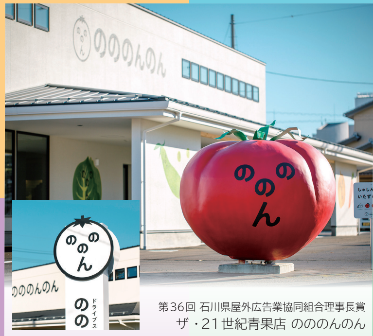
第36回 石川県屋外広告業協同組合理事長賞 ザ・21世紀青果店 のののんのん