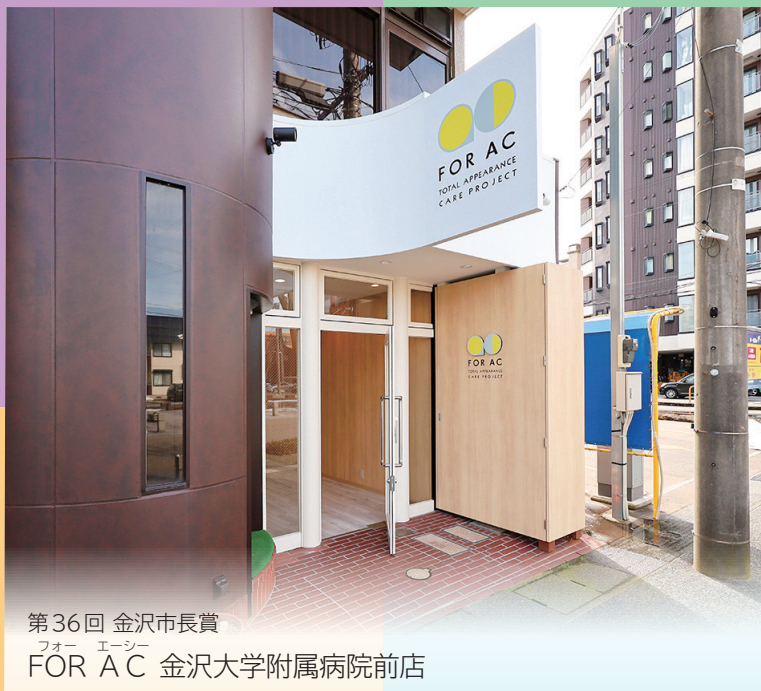
第36回 金沢市長賞 フォー エーシー FOR AC 金沢大学附属病院前店