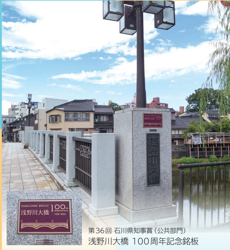
第36回 石川県知事賞（公共部門） 浅野川大橋 100周年記念銘板

都市景観等の向上と屋外広告物への関心を高めることを目的に、優れた屋外広告物に対して広告景観賞を授与いたします。多くの方々のご応募を賜りますようお願いいたします。