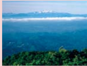
碁石ヶ峰から見た白山