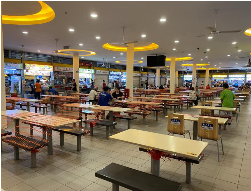
飲食する人が減少したホーカーセンター