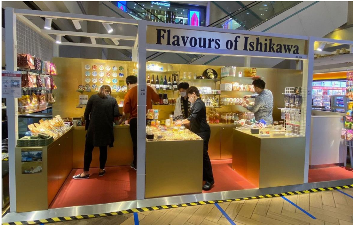
アンテナショップオープン初日の様子