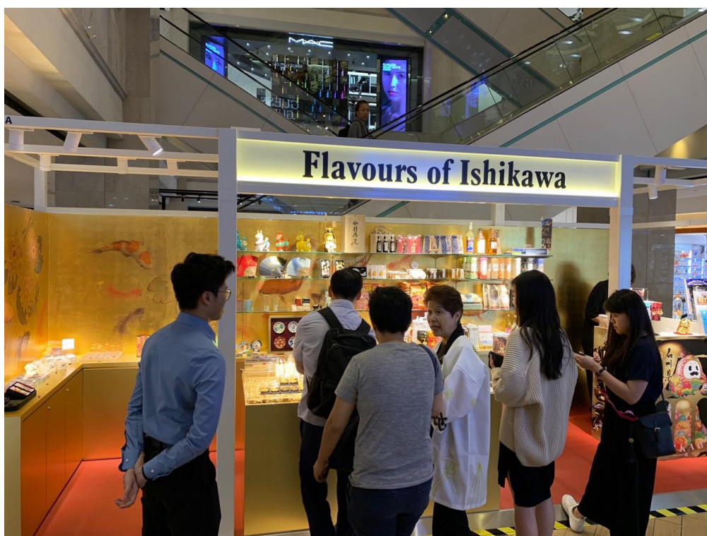
シンガポール石川県アンテナショップ「Flavours of Ishikawa」

モノがどのようにしたら動くのか、同プロジェクトに協力いただいている「I-O&YT Pte Ltd」と約3ヶ月間、アンテナショップを軸に当地の様々な場所でテストマーケティングを実施したいと考えています。