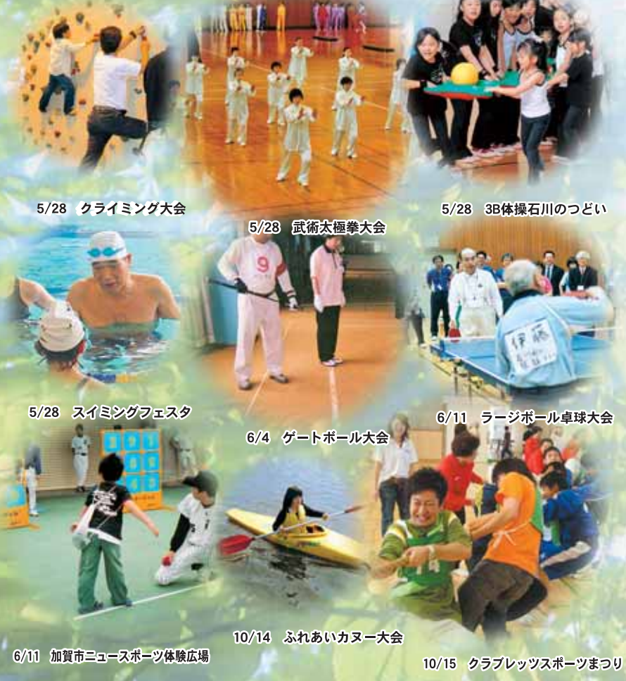
5/28 クライミング大会