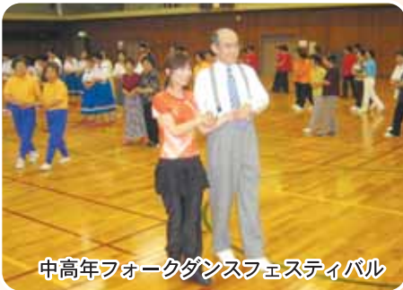
中高年フォークダンスフェスティバル