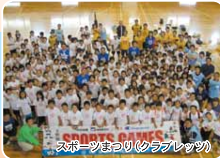
スポーツまつり(クラブレッツ)