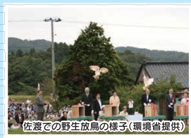
佐渡での野生放鳥の様子

飼育しているトキの数がふえたことで、国は、平成15(2003)年からトキを自然に帰すととりくみをスタートしました。佐渡では、自然環境を再生するととりくみが続けられ、平成20(2008)年、トキが佐渡で放鳥されました。平成30(2018)年8月現在、350羽をこえるトキが野生で生息し、石川県まで飛来したトキもいます。