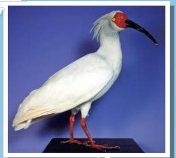
本州最後のトキ能里のはく製 いしかわけんりつれまきはくぶつかんしゅうぞう (石川県立歴史博物館収蔵)

石川県にトキが再び戻ってきたのは、40年後の平成22(2010)年。鳥インフルエンザなどからトキを守るために、佐渡トキ保護センター(新潟県)で飼育していたトキのつがい2組を、いしかわ動物園に移送し、飼育が始まりました。