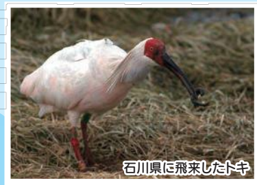
石川県に飛来したトキ