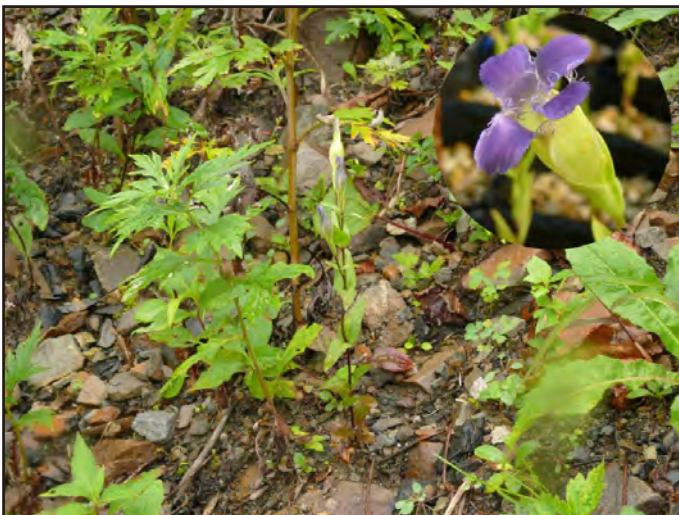
白井伸和・2006年9月12日・白山

一部の自生地は斜面の崩壊で激減。近年、10~30株程度が結実するが、ノウサギの食害が目立つ。