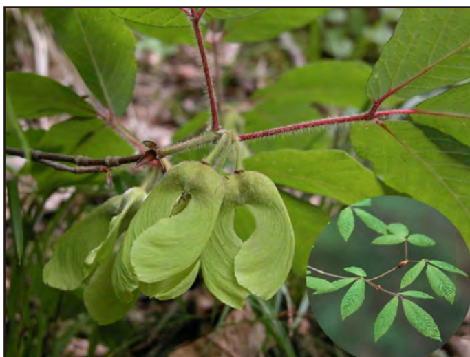
林 二良・2005年6月19日・内浦・(葉) 白井伸和