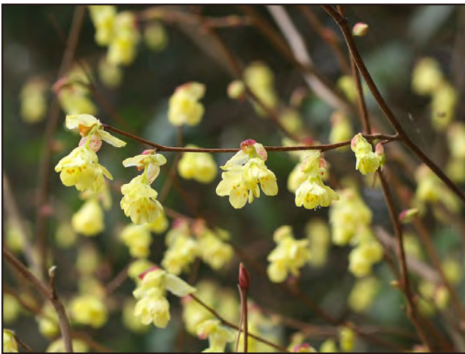
本多郁夫・2005年4月2日・加賀市

生育地には特定植物群落に指定されているものもある。鞍掛山を中心とする産地の地質は酸性岩の緑色凝灰岩で、塩基性の蛇紋岩地帯ではない。