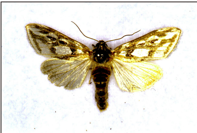
標本提供者: 富沢章

富沢 章 1998. 石川県でアオモンギンセダカモクメを採集. 蛾類通信, (202) : 32.