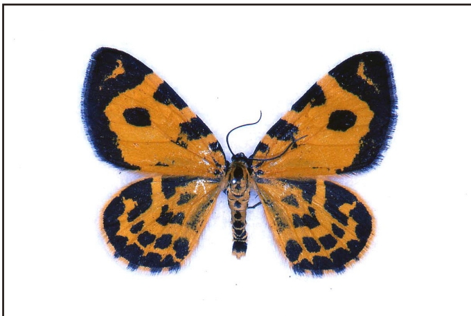
標本提供者: 富沢章

西尾規孝 1986. 木曾山脈将基頭山付近に生息する蛾類の生態. 誘蛾燈, (105) : 75-90.