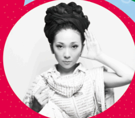
MISIA (アーティスト) mufef Ambassadorとして 「MISIAの森」 プロジェクトを実施