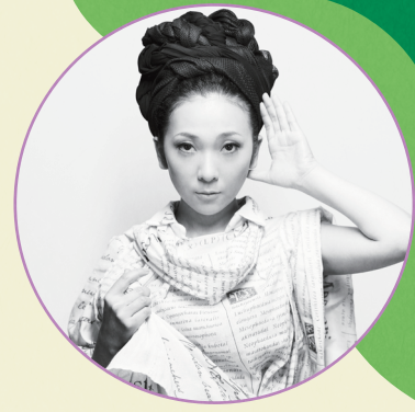
MISIA(アーティスト) mudef Ambassador として 「MISIAの森」プロジェクトを実施

https://www.pref.ishikawa.lg.jp/sizen/ontai/soundwave.html