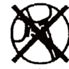
酸性タイプと併用不可