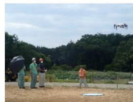
（事業2：ドローン研修）