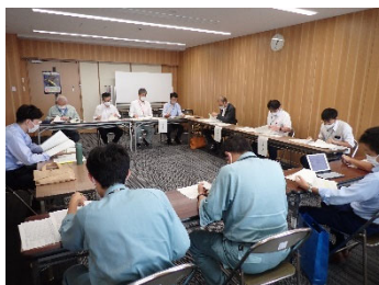
(地域協議会による広域調整)