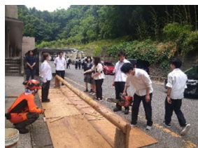
（事業1：林業出前講座）