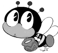
「マナビイ」 生涯学習マスコットマーク