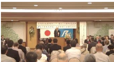
創立 50 周年記念式典

引き続き行われた修了証書交付式には、平成 27 年度修了生 656 名(大学校 635 名、