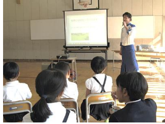
白山市立白峰小学校での出前講座の様子

各講師の分かりやすく熱のこもったお話に、子どもから大人まで幅広い年齢の受講者から好評をいただきました。