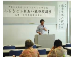
第 2 回講座の様子

各講師は、専門性の高い内容を AV 機器を活用して丁寧に分かりやすく講義していただき、多くの受講生から好評をいただきました。