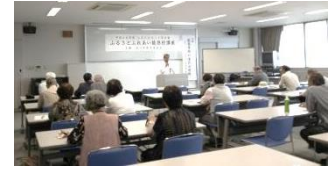
第 1 回講座の様子

今年度は「能登寺院の金沢出開帳」を始めとする、石川の文化・歴史・自然等をテーマとした全 6 回の講座を実施しました。