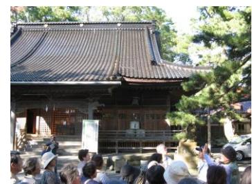
第4回 輪島市 重蔵神社にて

「醤油の里大野」「金沢城」「重伝建寺町台」の金沢3講座のほか、「小松のものづくり」「能登平家物語」「海から見た能登の歴史」をテーマにした加賀1・能登2の講座を実施しました。