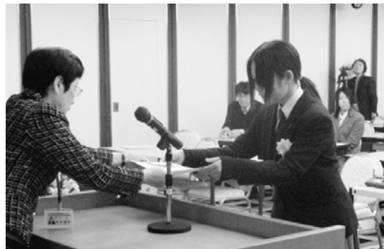
いしかわビデオ作品コンクール表彰式 (3月)