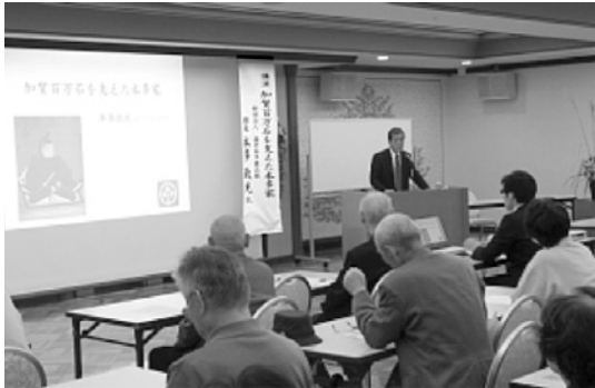
マナビフェア特別講演会 (11月)

平成24年5月25日発行／石川県立生涯学習センター 〒920-0935 金沢市石引4-17-1 石川県本多の森庁舎 TEL. 076-223-9571 生涯学習センター ホームページ http://www.pref.ishikawa.lg.jp/shakyo-c/