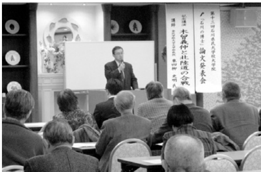
石川県民大学校大学院論文発表会 (1月)