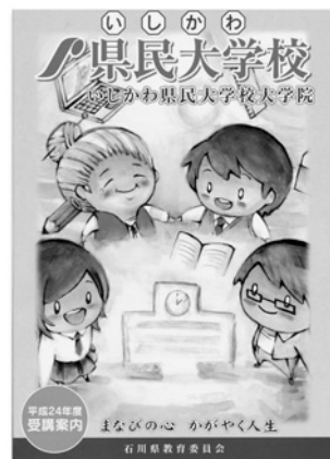
受講案内の表紙デザインは、石川県立工業高等学校の生徒による作品です。

また、受講案内送付希望の方は、 210円分の切手 を同封し、住所、氏名を明記の上、下記石川県民大学校事務局までお申込みください。