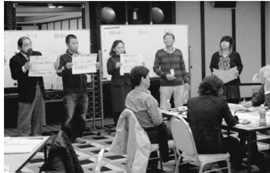
ファシリテーター養成講座 (12月)