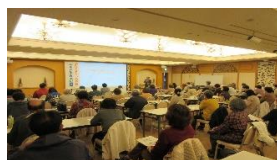
*写真は、昨年度の様子