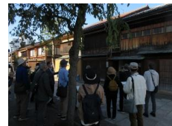
*写真は、昨年度の様子