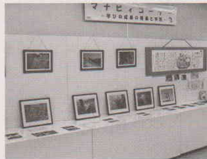
白山セミナーハウス じおくらふい 作品展