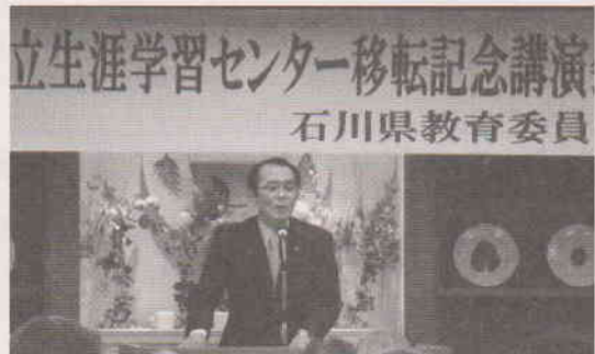
生涯学習センター移転記念式典 (4月)