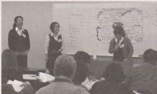
ファシリテーター後期実地体験報告会 (12月)