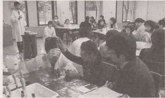
びっくり科学教室 (12月)