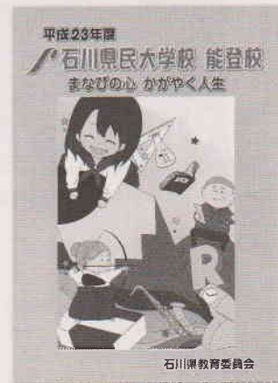
上のリーフレットの表紙デザインは石川県立七尾東雲高等学校の生徒作品によるものです。