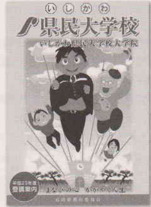
上の受講案内の表紙デザインは、石川県立羽咋工業高等学校の生徒作品によるものです。