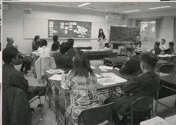
生涯学習ファシリテーター養成講座 (9月)