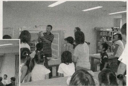
夏休み子ども陶芸教室 (8月)