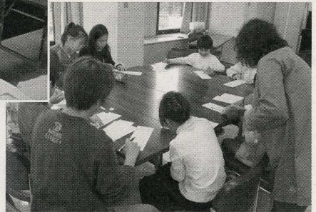
家族で楽しむ俳句教室 (12月)