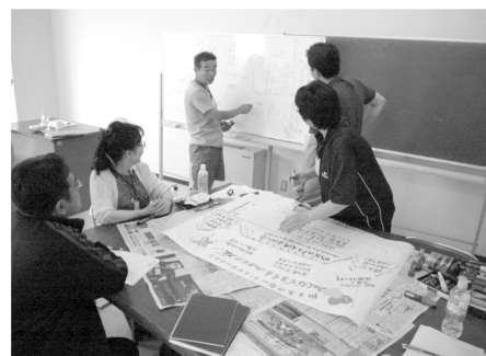
活 動 風 景

Cさん この研修を受けるまでの私にとってのファシリテーターというものに対する理解は、会議や活動の現場での盛り上げ役という程度のものでした。研修の中で、その役割、立ち位置、重要性を学んでいく中で、これはまさに今後の生涯学習の推進・展開にあたり、欠かすことのできない存在であり、カギになっていくものであると確信しました。