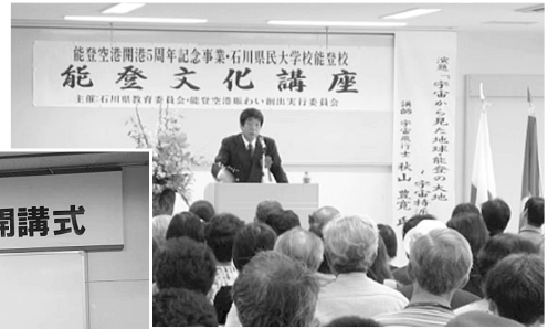
能登文化講座 (7月) 講師 宇宙飛行士 秋山豊寛氏