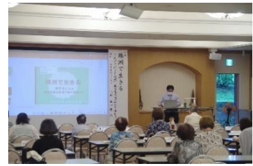
③受講中の座席は隣席との距離を確保します。また、休憩中は換気を行います。