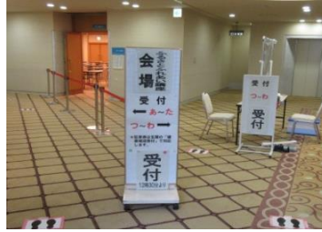
②会場前での密を避けるため受付を2か所設置しています。入口付近で消毒をします。