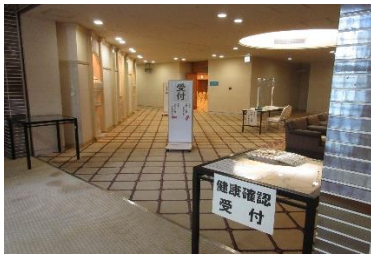
①会議室前「健康確認受付」で検温、手指消毒します。