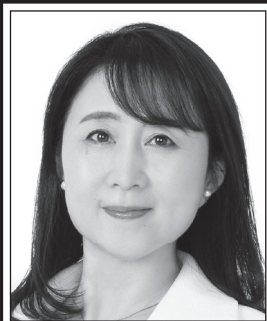
やた わか子 国民民主党 副代表 あなたと動けば、 未来は変わる。