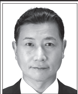
よしかず たるい 良和 元衆議院議員 表現の自由を守る・ 日本V字回復やったるい