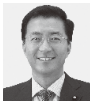
党副委員長 山下 よしき 現 59歳。参院議員3期。 活動地域 大阪、兵庫、滋賀、奈良、和歌山