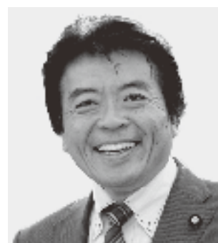
弁護士 仁比 そうへい 現 55歳。参院議員2期。党参院国対副委員長。 活動地域 中国、四国、九州・沖縄