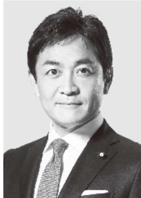
国民民主党 代表 玉木雄一郎