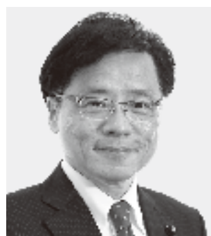
党参院幹事長・国対委員長 井上 さとし 現 61歳。参院議員3期。 活動地域 東海、北陸信越、京都