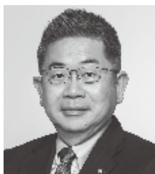
党書記局長 小池 晃 現 59歳。参院議員3期。全国革新懇代表世話人。医師。 活動地域 東京