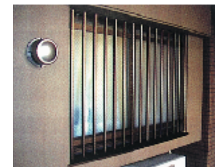
共用廊下に面した腰高窓の面格子