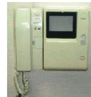
住戸玄関の外側との間で通話が可能なインターホン