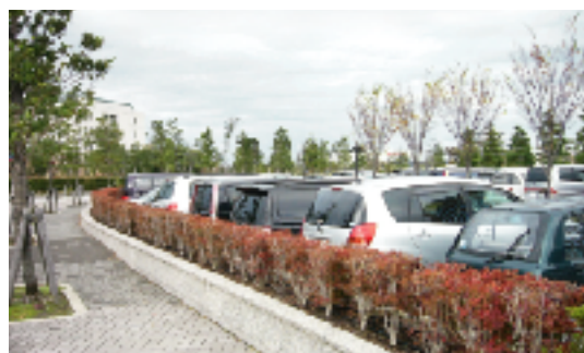
周囲を植栽で区分した駐車場