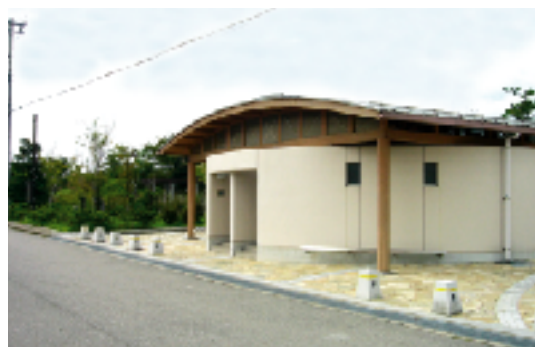
公園出入口に設置された公衆便所

従来、便所は人目につきにくいようにしてきたことから、危険性の大きい場所になりがちであったが、防犯の面からは周辺の道路、住宅又は園路等からの見通しを確保することが重要となる。