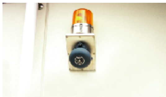
公衆便所の警報灯

便所の個室でわいせつ行為等の犯罪も発生しているため、個室等には防犯ベルの設置が必要となる。