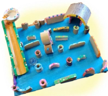
【竹細工】竹コロ迷路