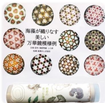
【海藻おしば】海藻万華鏡