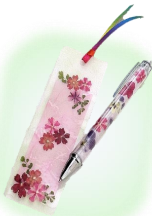
【押し花】ボールペンとしおり