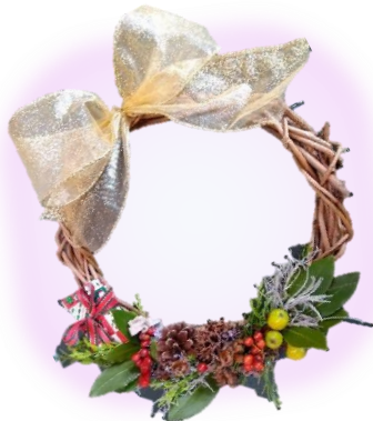
【ハーブ加工】 クリスマスリース