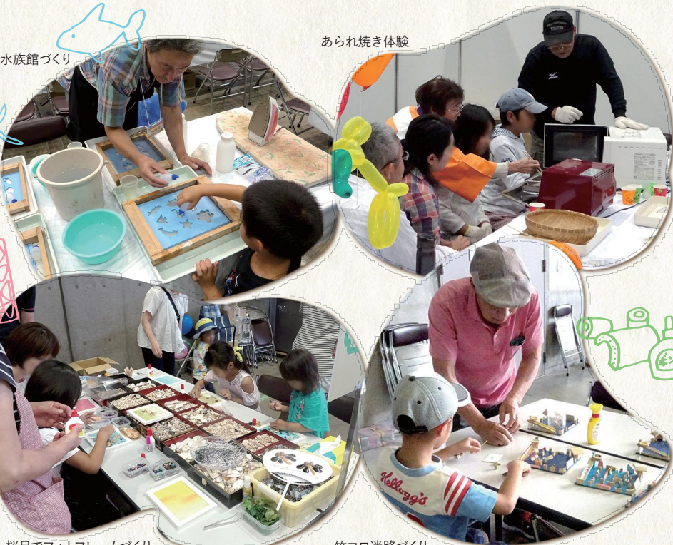
桜貝でフォトフレームづくり