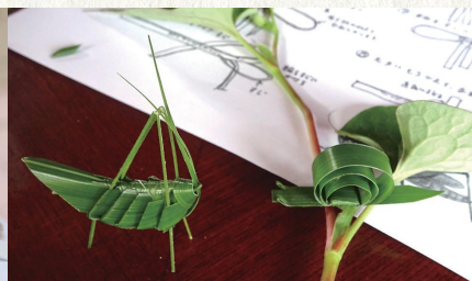
ふるさとの匠の技「葉細工」