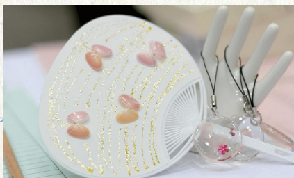
ふるさとの匠の技「貝細工」