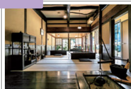
食事はテーブルようになった足を下ろせる囲炉裏端で