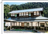
手取川のすぐ近くに建つ