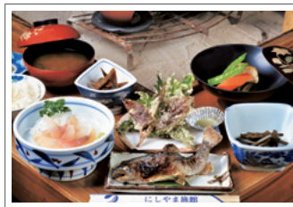
イワナの塩焼きや季節の山菜、きのこ料理など