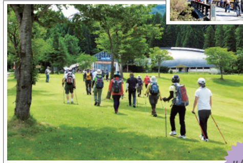
豊かな自然からたくさんの感動がもらえる