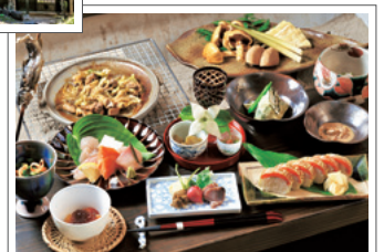
夕食は山の幸満載。ニジマスの棒寿司が名物