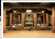
地域の浄土真宗の信仰拠点