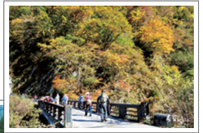
季節ごとに森の香りが違う

☎076-256-7933(岩間山荘) ⑩10:00集合(一里野スキー場あいあーの前。5月、7月、9月は集合場所変更のため要問合せ) ②2,500円(昼食・入浴料など含) ※歩きやすい靴、防寒具・雨具などをご持参ください。