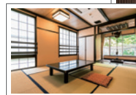
囲炉裏付きの部屋もある