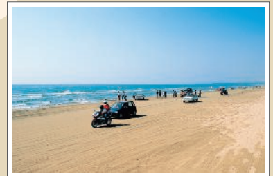
波打ち際を車で走ることができる羽咋市の千里浜なぎさドライブウェイ