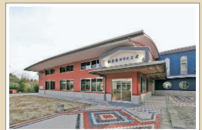
吹きガラスやトンボ玉づくりができる能登島ガラス工房