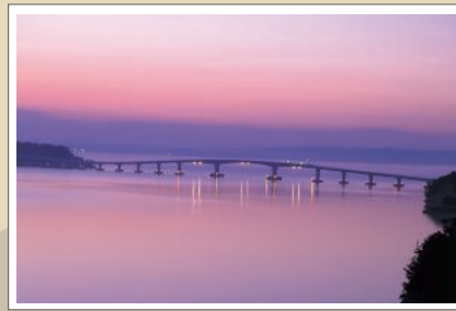
和倉温泉と能登島を結ぶ能登島大橋