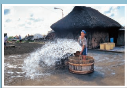
珠洲の揚げ浜式製塩