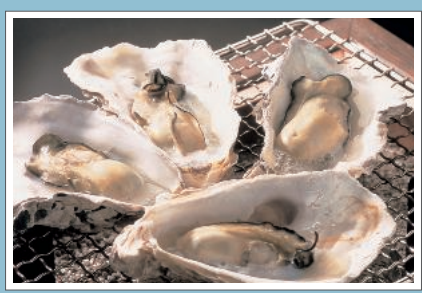
波穏やかな七尾湾で養殖される能登かき