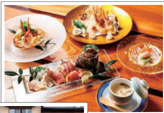
夜のコースの一例