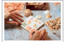
約10センチ四方の板に貝をあしらって作るミニアート

⑤所要30分～1時間程度 ⑥ミニアート1,200円～、キーホルダー2,000円、ピアス・イヤリング2,200円など