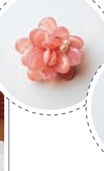
ブローチやイヤリングなどアクセサリーも販売