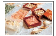
増穂浦海岸に打ち上ったさまざまな貝