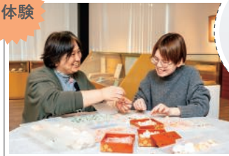
貝殻を一枚一枚丁寧に組み合わせていく