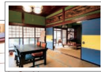
1階は共有スペース