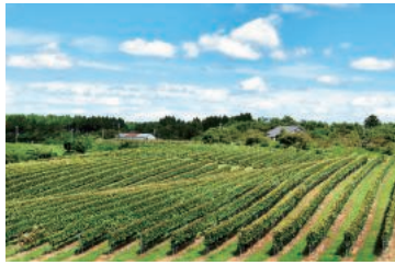
能登の大地に広がる美しいブドウ畑