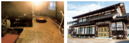
上段:里山のめぐみがたっぷりの食事。栗ご飯やキノコの天ぷら、旬の野菜の煮物など 下段左:石造りの浴槽と五右衛門風呂がある