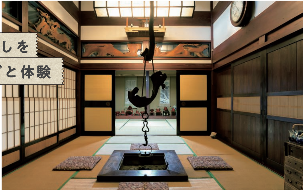
自然の中で、里山の暮らしを体験。温かなおもてなしに何度でも訪れたいくなります

①能登町字宮地周辺 ☎0768-76-0021(春蘭の里事務局) ②1泊2食13,200円~(人数によって変動あり) https://shunrannosato.info/