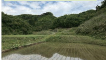
山から直接流れ出る源流水でコメを栽培