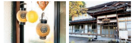
上段:囲炉裏を囲んで団らんのひとときを 下段左:土地の祭りでかつて使っていた提灯。思い出話を聞いてみよう