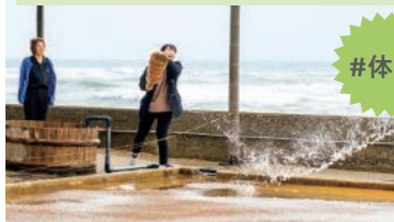
海水を塩田に撒く作業を体験