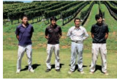
ワイン造りを手掛けるスタッフ