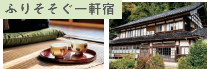
上段:広々とした畳の上でのんびり 下段左:日向ぼっこでポカポカ気分