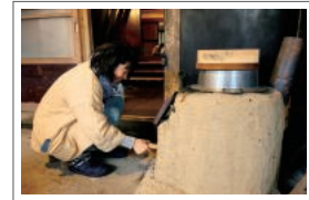
ご飯はかまど炊き。 未来さんに教えて もらいながら一緒に 炊く体験も可