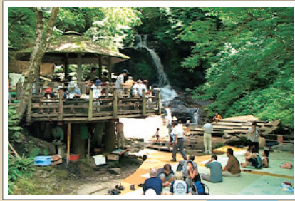
木窪大滝の大滝憩いの広場では、流しそうめんや岩魚のつかみ取りができる

金沢市とその周辺のかほく市、野々市市、津幡町、内灘町のエリア。県都「金沢」は、江戸時代に加賀百万石の中心部として栄え、今もそこかしこに江戸時代の面影が残る観光地ですが、ひと足のばせば、遠浅の美しい海と砂丘が広がり、多くの渡り鳥が飛来する河北潟など、身近な自然の素晴らしさを再発見できます。