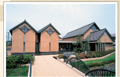
豪商「銭屋五兵衛」の生涯を紹介する石川県銭屋五兵衛記念館