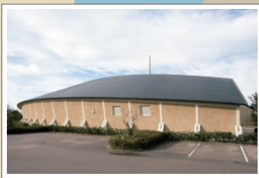
能登半島の海の民俗資料を今に伝える海と渚の博物館