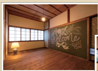
黑板アートがおしゃれな客室