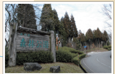
石川県森林公園では、四季折々の変化に富んだ里山の自然を楽しむ