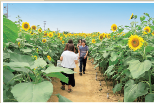
35万本ものひまわりが咲く、河北潟のひまわり迷路