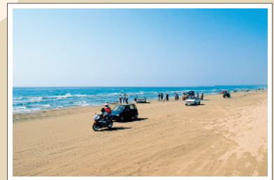
波打ち際を車で走ることができる羽咋市の千里浜なぎさドライブウェイ