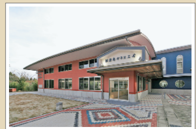
吹きガラスやトンボ玉づくりができる能登島ガラス工房