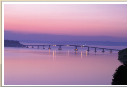
和倉温泉と能登島を結ぶ能登島大橋