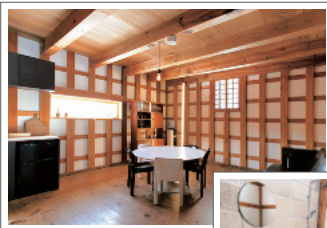
1階はリビングとバスルーム、2階はベッドルーム

①1泊(1組限定4名まで) 1名22,000円、1名追加ごとに+3,000円(4名宿泊時は合計31,000円) *CRAFT&STAYのディナーを利用可能(予約制)