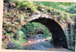
明治後期に作られたアーチ型の石橋

滝ヶ原の石文化の歴史は古く、弥生時代には碧玉の産地であり、玉つくりといわれる加工技術も発達しました。江戸後期からは滝ヶ原石の採掘が始まり、その石切場跡が多く残されています。町の5カ所に架かるアーチ型の石橋は明治から昭和期に築かれたもので、趣ある景観を生み出しています。