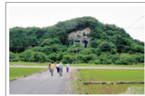
里山の生き物調査やウォーキングなどのイベント情報はHPで発信