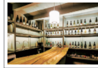
ナチュラルワインが楽しめるMOSS BARも併設

①1泊 Bunk Bed Room 1名5,500円 / Band Room 1名9,000円、1名追加ごとに+5,000円(4名宿泊時は合計24,000円) / Director's Suite 2名18,000円、3人目から+5,000円(4名宿泊時は合計28,000円) ディナーの詳細は要確認