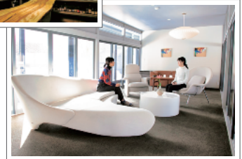
有名デザイナーによる家具がレイアウトされている。敷地内の工房では木地を挽いたり漆器制作を見学することも