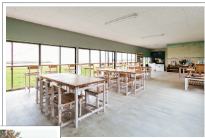
店内の一角では島の特産品を販売