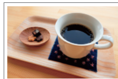
ドリンクのテイクアウトも可能