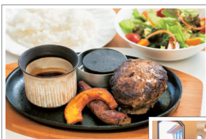
能登牛入り鉄板のせ ハンバーグステーキランチ1,760円

㊦七尾市能登島向田町128-81 ☎0767-84-1090 ㊦11:00~15:00、ディナータイムは要予約 ㊦火曜(祝日の場合は営業) https://haikara-syokudo.com/