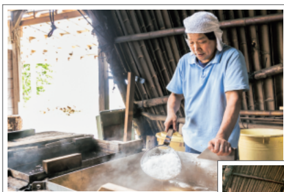
4日間かけて一度に作られる塩は30kgほど

㊦七尾市能登島長崎町28-9(長崎多目的集会場) ☎0767-84-1702(能登島自然の里ながさき事務局) ※自宅電話番号のため、不在の場合はご了承ください ㊦応相談(所要時間は1~2時間。調整可能) ㊦不定休 ㊦1人1,500円 ※最大50人まで体験可能