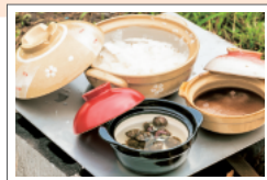
土鍋を使った塩づくり 一緒に貝も煮て食べる