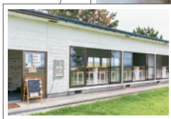
浜茶屋をリノベーション

㊦七尾市能登島八ヶ崎町 ㊦夏期のみ営業予定※営業はHPで確認を https://masoi.net/