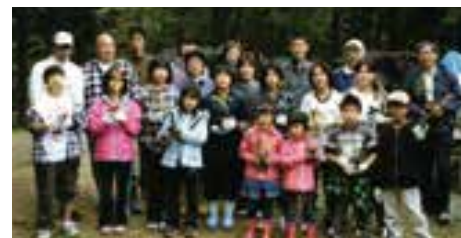
ドングリの苗木を植栽

林道整備や修理費用などの資金の不足をはじめ、ツリークライミングやトレッキングの指導者の不足、子どもたちの減少などが課題です。