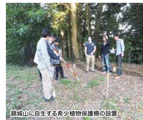
錦城山に自生する希少植物保護柵の設置

私たちは働きながら高校に通っています。1日の仕事を終えてから夜9時5分までの授業を受けるという生活ですので、放課後に活動する時間はありません。限られた「総合的な学習の時間」を活用して取り組んでおり、活動時間が少ないことが課題です。