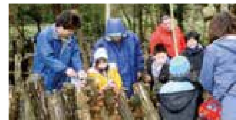
シイタケ採取体験