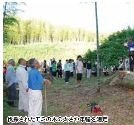
伐採されたモミの木の太さや年輪を測定