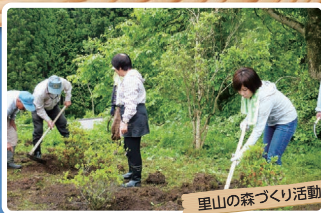
里山の森づくり活動