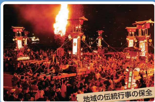
地域の伝統行事の保全