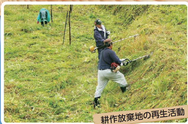
耕作放棄地の再生活動

「いしかわり山ポイント制度」は、より多くの方々に里山里海保全活動へ参加していただくための制度です。