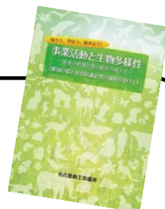
名古屋市の企業の 取り組みをご紹介します。

生物多様性ガイドブックをもとに、御社の事業活動と生物多様性について評価し、生物多様性の保全や里山里海を次の世代に引き継ぐために、どのような取り組みができるか、具体的な目標を立てます！！