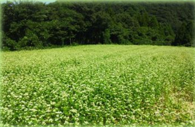
【奥能登の耕作放棄地を再生し、新しい能登ブランド商品を開発】