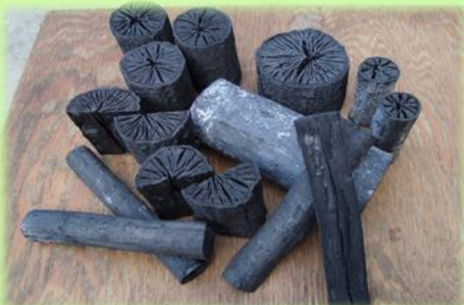
【お茶炭のブランド化による能登製炭業の活性化事業】