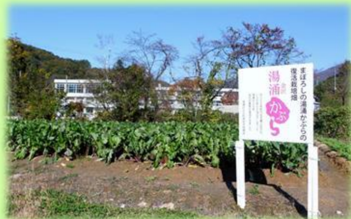
【地域の特産野菜の生産振興と魅力的な商品開発】