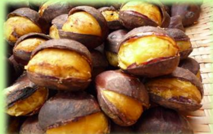
【里山で栽培した能登栗を活用した商品づくり事業】