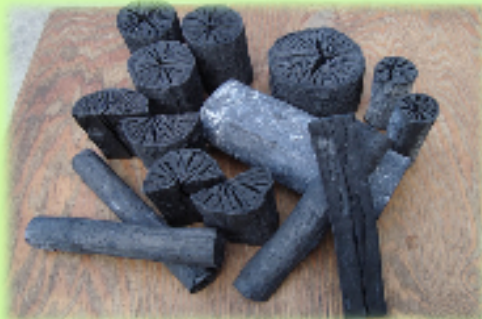
【お茶店のブランド化による焼炭製菓業の活性化事業】