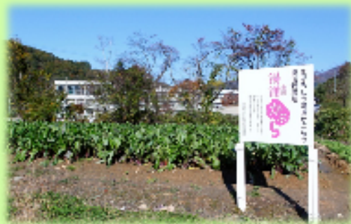
【地域の特産野菜の生産振興と魅力的な商品開発】