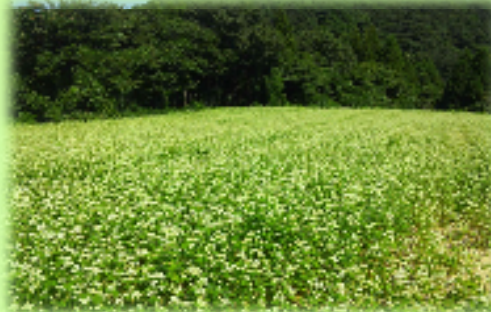
【奥能登の耕作放棄地を再生し、新しい能登ブランド商品を開発】