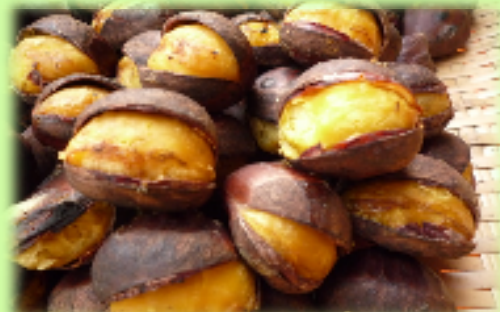
【里山で栽培した能登栗を活用した商品づくり事業】