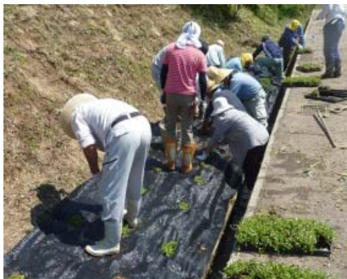
【ヒメイワダレソウの植栽作業】

その他、農業生産活動が円滑に継続されるよう田を耕作しやすい形に整備したり、用水ポンプを設置するなどの生産基盤整備の拡充している。さらには棚田米やじゃがいもなどの野菜を直売所で販売したり、自然生態系を学習する場として、地元小学生と一緒に集落内の生き物調査を行ってビオトープ（野生の生き物のすみか）を作るなど、本交付金を活用して様々な活動を行っている。