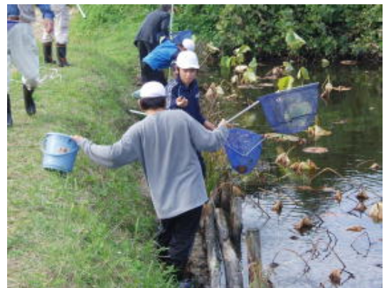
【地元小学生との生き物調査】