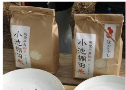
【小池棚田米を販売】

今後も地元産米のブランド化などに取り組み、世界農業遺産の認定地域として将来のことは見据えた農業形態への移行や集落の活性化に本交付金を有効に活用していきたいと考えている。