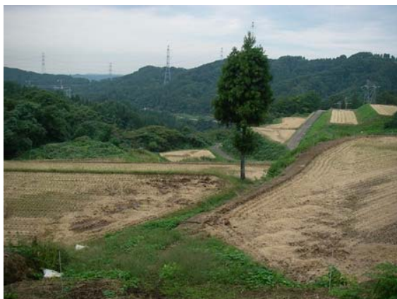
【砂子坂地区の農地の状況】

また、二俣集落ではほ場整備を早期に完了させ、本交付金を活用して、次世代の農業後継者が継承しやすい農業の基盤整備を行うほか、担い手の確保として地域の建設業の農業参入を受け入れたり、他県の棚田地域を視察して先進的な生産、販売の技術情報の交流を行っている。都市住民との交流では、地域の魅力をPRするパンフレット作成するなどして、二俣及び周辺地域を活性化させている。