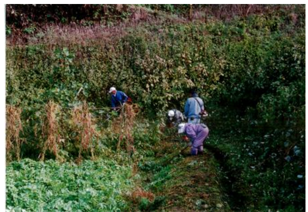
【共同作業（水路周辺の草刈り）】